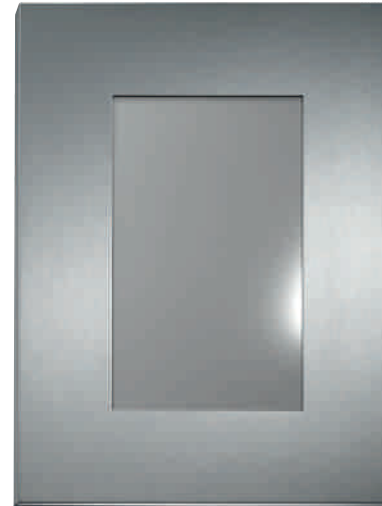
Passepartout Magnetrahmen Passepartout magnetic frame

The vast range of possibilities offered by the Passepartout magnetic frame provides you with maximum creative freedom. The frame surface extends into the design by means of silk screen printing and is thus exceptionally well-suited for exhibition notes and publicity purposes. Rather than using an imprint, embossing and other special solutions are also possible. The prices for all stainless steel (EG) designs are indicated in the price table. We would be delighted to quote you for all other colour surfaces as a customised Passepartout magnetic frame on request.