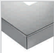
EG „Edelstahl“ geb. Stainless steel br.