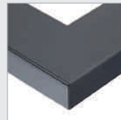
S Schwarz matt, pulverbeschichtet Black matt, powder-coated