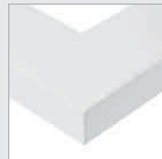
W Verkehrsweiß matt, pulver- beschichtet Traffic white matt, powder-coated