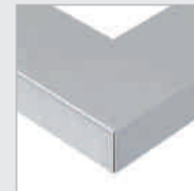
AGN Aluminium geb., Natur, eloxiert Aluminium br., Natural, anodised