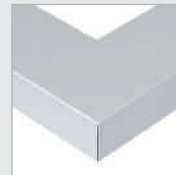
AM Aluminium matt, eloxiert Aluminium matt, anodised