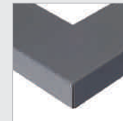
AGS Aluminium geb., Schwarz, eloxiert Aluminium br., Black, anodised